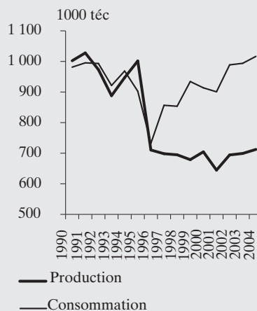
Au Royaume-Uni la production de viande bovine pour la consommation n'a pas repris depuis 1996

Source : Defra - situation au 31 août 2005